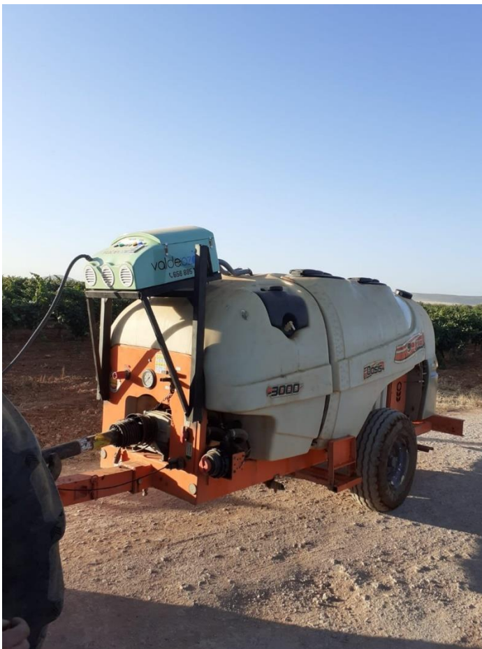
Imagen del equipo ECOAGRO instalado en el atomizador de un cliente.

No debemos preocuparnos por el impacto medioambiental en caso de tener que realizar aplicaciones con mayor frecuencia, pues el ozono se degrada en el aire y no deja ningún tipo de residuo en la planta ni en el terreno, al contrario de lo que sucede con los productos fitosanitarios.