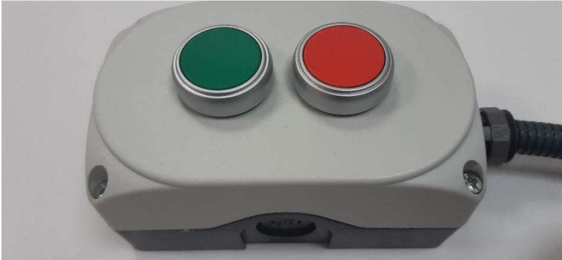
Imagen del mando de encendido/ apagado.