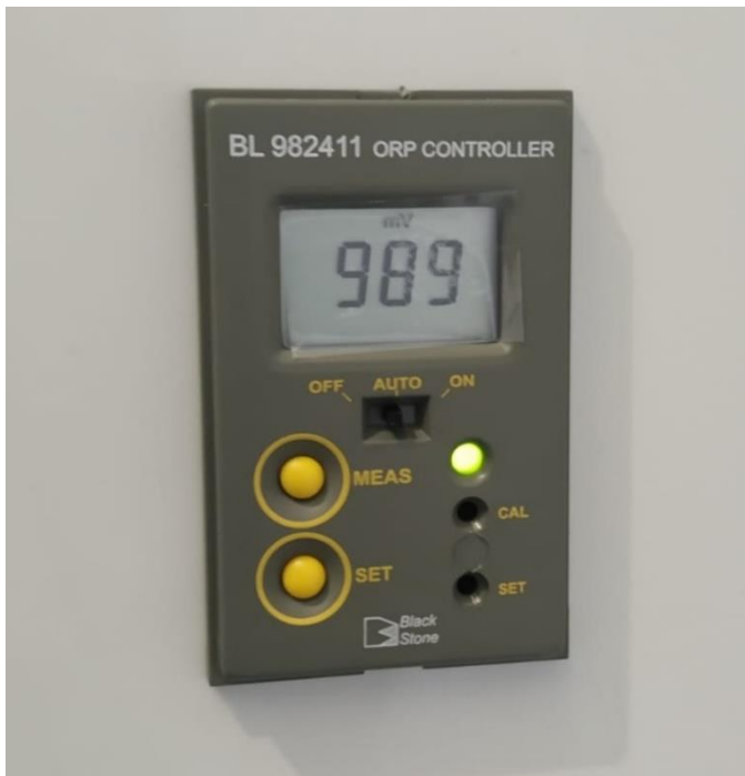
Indicador frontal de la sonda Redox

SIEMPRE pulverizar con agua ozonizada si el nivel de REDOX no es mayor a 650 mV. Lo ideal es utilizar el sistema obteniendo unos valores de superiores a 650 mV, de no ser así, llamaremos inmediatamente al servicio técnico, el cual se personará in situ para solucionar el problema si fuese oportuno.